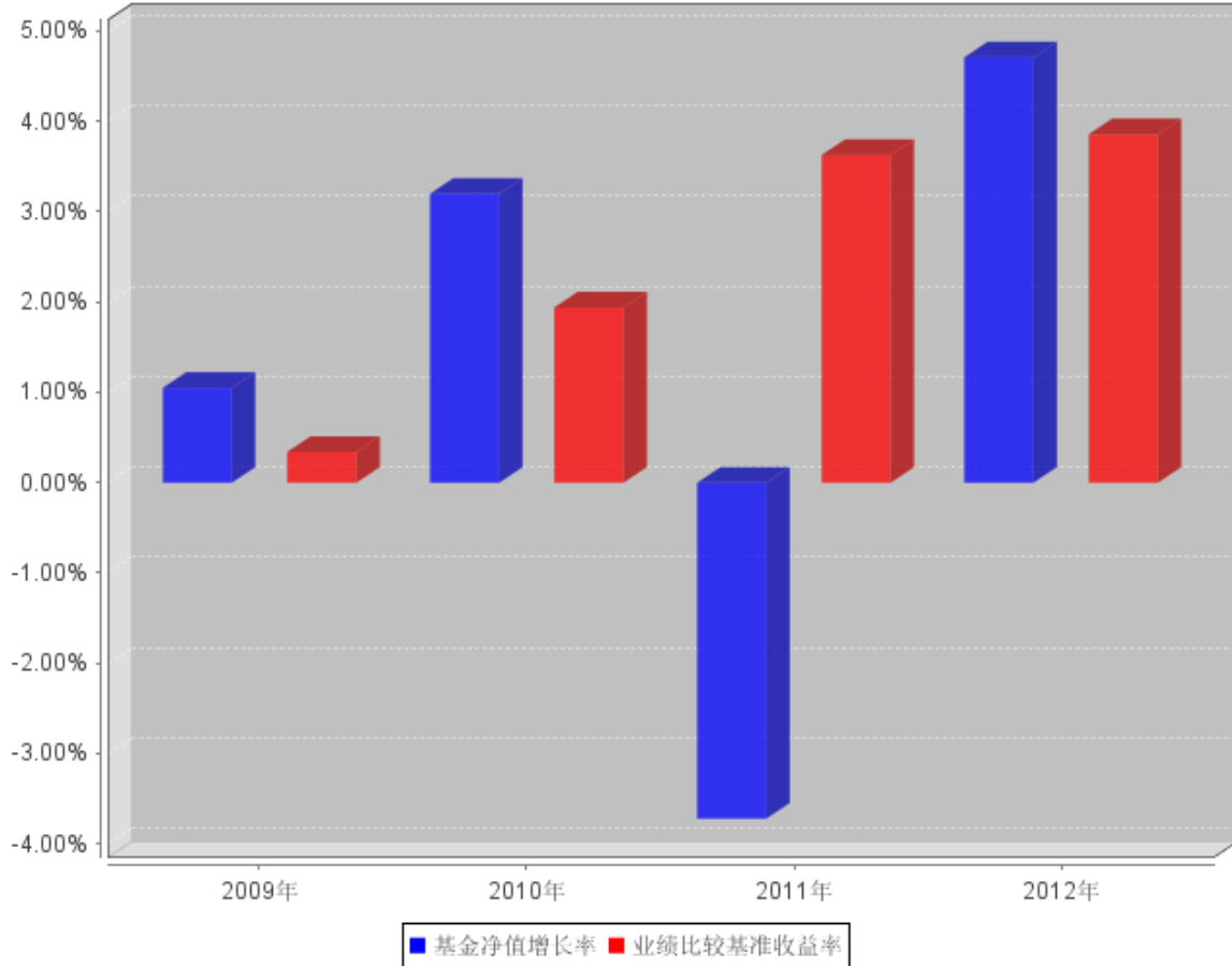
自基金合同生效以来基金每年净值增长率及其与同期业绩比较基准收益率的对比图

注：2009 年数据统计期间为 2009 年 7 月 23 日（基金合同生效之日）至 2009 年 12 月 31 日，数据按实际存续期计算，不按整个自然年度进行折算。